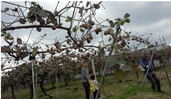
(キウイフルーツ風景)