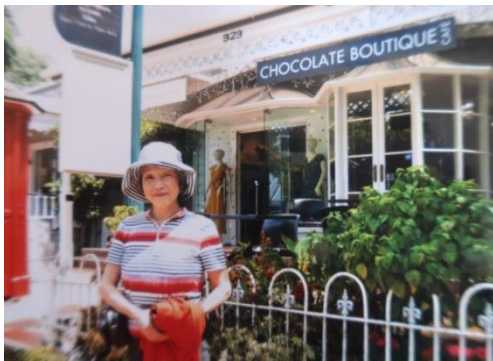
(チョコレート店の前にて)

もっと買ったかったのですが、時間がなく、たった1粒を選んだ所で呼び出され、とても残念です。何方か又お行きになる時は、宜しく願います(笑)